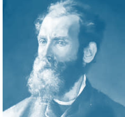
Antero de Quental