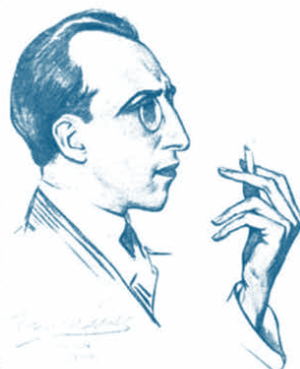
Desenho de Eduardo Malta